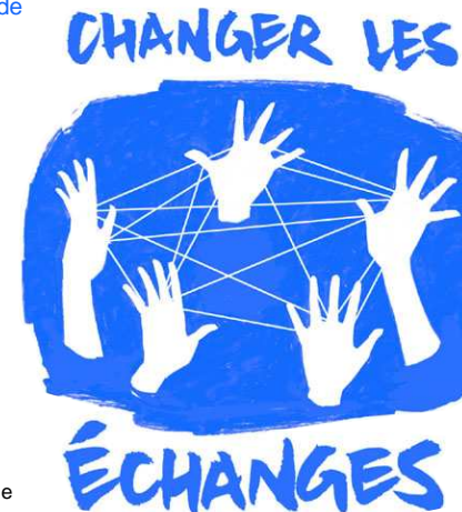
Illustration de Jean-Luc Boire

Samedi 3, Maison de Quartier saint-Nicolas, jardin de la Banque de France et Médiathèque Simone de Beauvoir, de 9h00 à 18h30